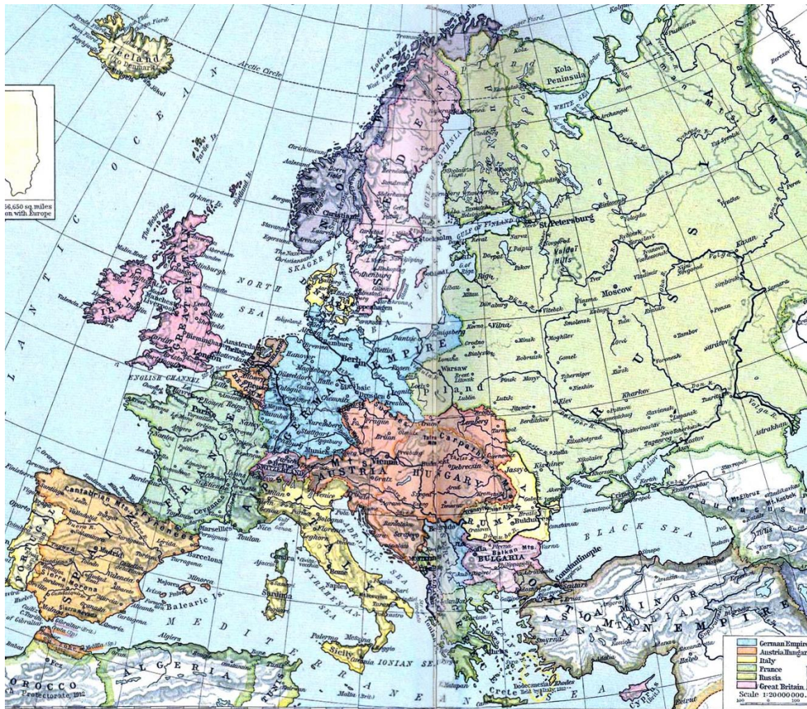
Europa w przeddzień wybuchu I wojny światowej